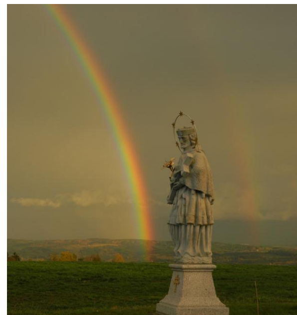
Abbildung B: Der von uns renovierte Hl. Nepomuk strahlt mit dem Regenbogen um die Wette. Er wird heuer die Pilger beim Einzug nach Maria Kulm begrüßen. Wir alle hoffen bereits jetzt auf ein gutes Gelingen der heurigen Fußwallfahrt zu unserer lieben Madonna vom Kulm.